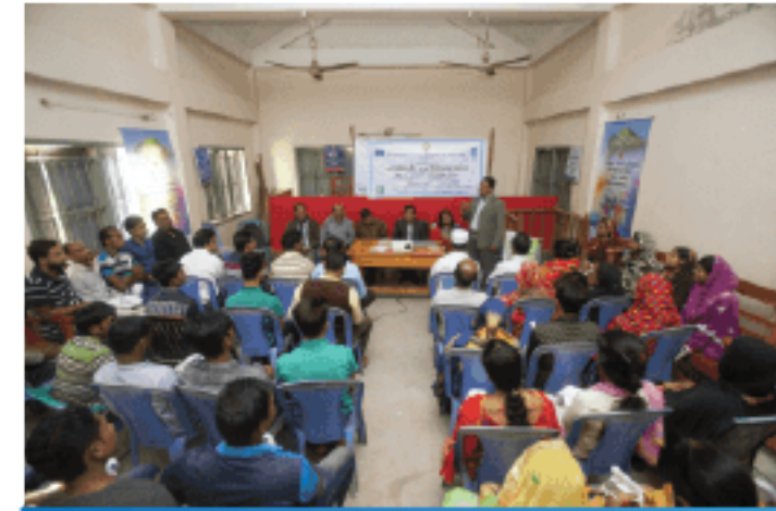
Participants of a community sharing meeting at union level express their interest and commitments to make village courts functional with their active involvement at various levels