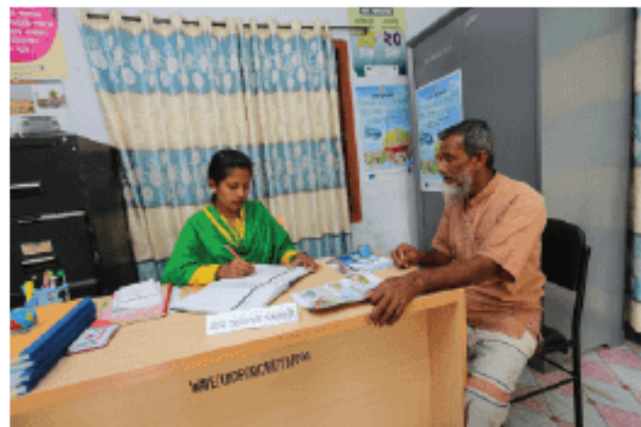
Registering a case in a Village Court is very easy for its service seekers

If cases were diverted from the district courts quickly enough, it would reduce the burden on the formal judiciary system and the law enforcement agencies, and ensure that the rural poor can gain access to legal remedies. The rationale for guiding the required policy reforms is also supported by our cost-benefit analysis.