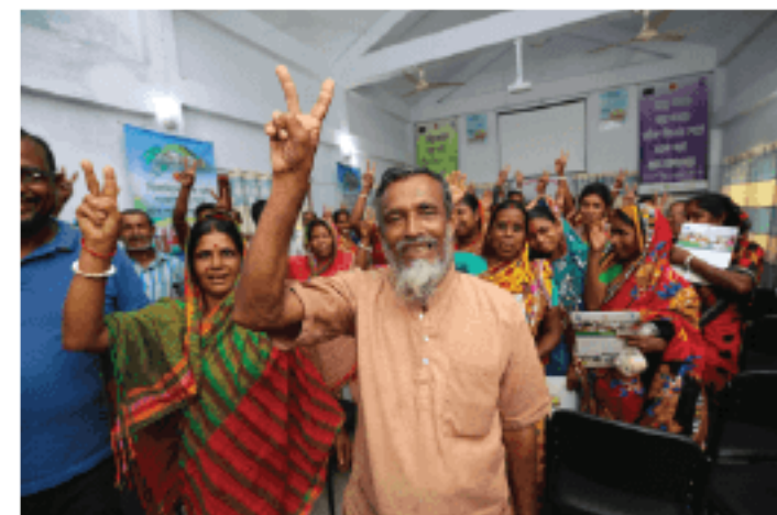
Villagers are expressing their happiness after resolving a case through Village Courts

Sources of LGRD and UNDP office stated that, the village courts would also empower local people, especially women and vulnerable people.