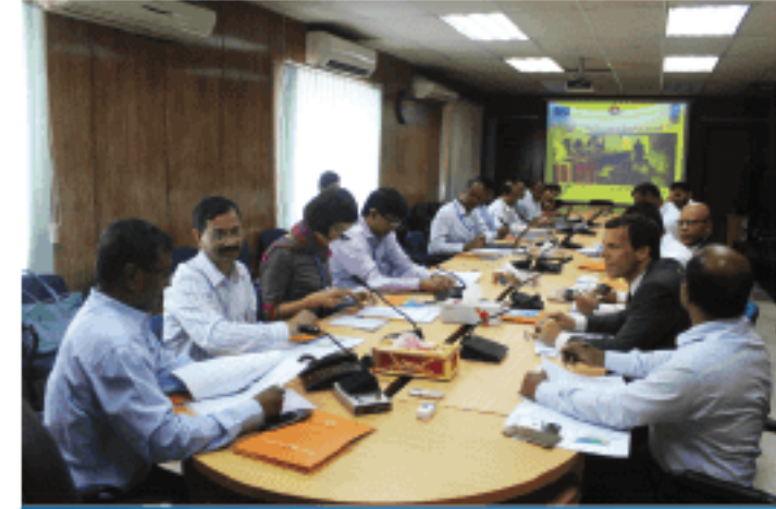
Participants of the Project Steering Committee share their recommendations to push the AVCB II Project forward with policy guidance and facilitating inter-ministerial coordination